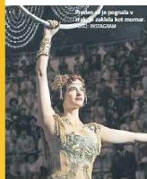
Priznanje je pogleda v življenje, odlična kot mnogi drugi filmi.